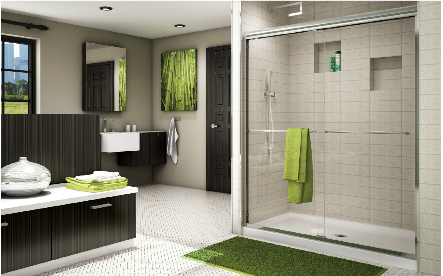
Model shown / Modèle présenté : Cordoba (E51060-11-40)