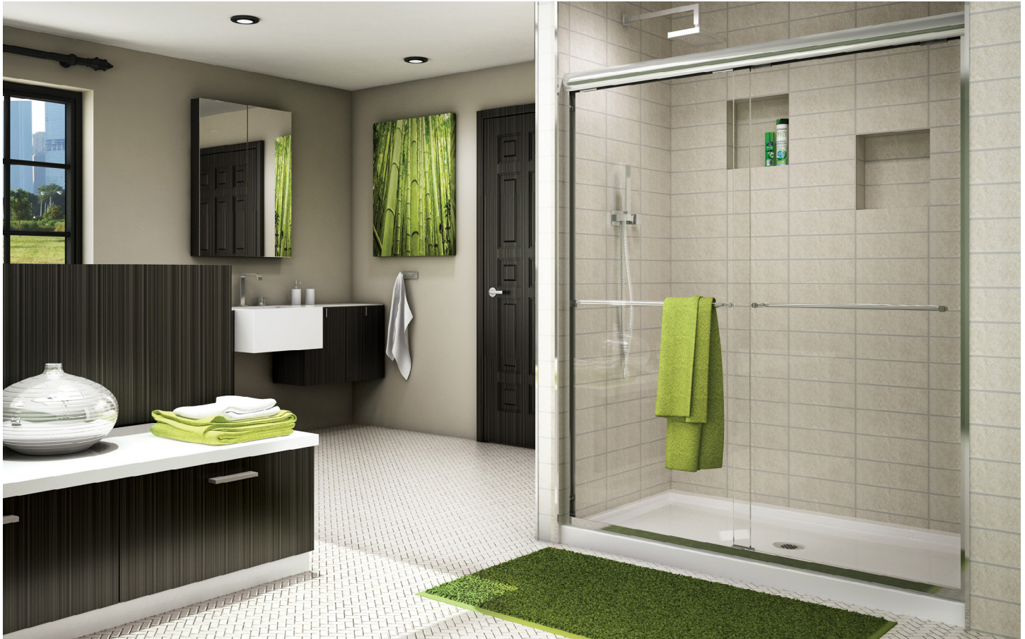
Model shown / Modèle présenté : Cordoba In-line Bypass / Cordoba en alcôve bidirectionnel (CS160-11-40)

Semi-frameless in-line sliding shower doors / Portes coulissantes pour douche avec cadre partiel