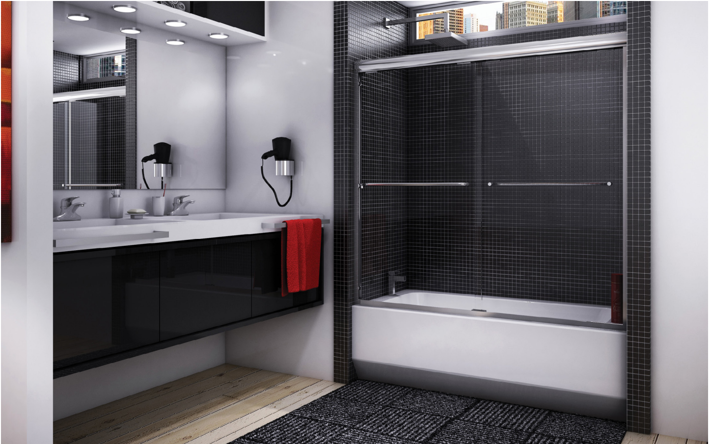
Model shown / Modèle présenté : Cordoba Bypass Tub Enclosure / Cordoba baignoire bidirectionnel (CT860-11-40)

Semi-frameless in-line sliding tub doors / Portes de baignoire coulissantes avec cadre partiel