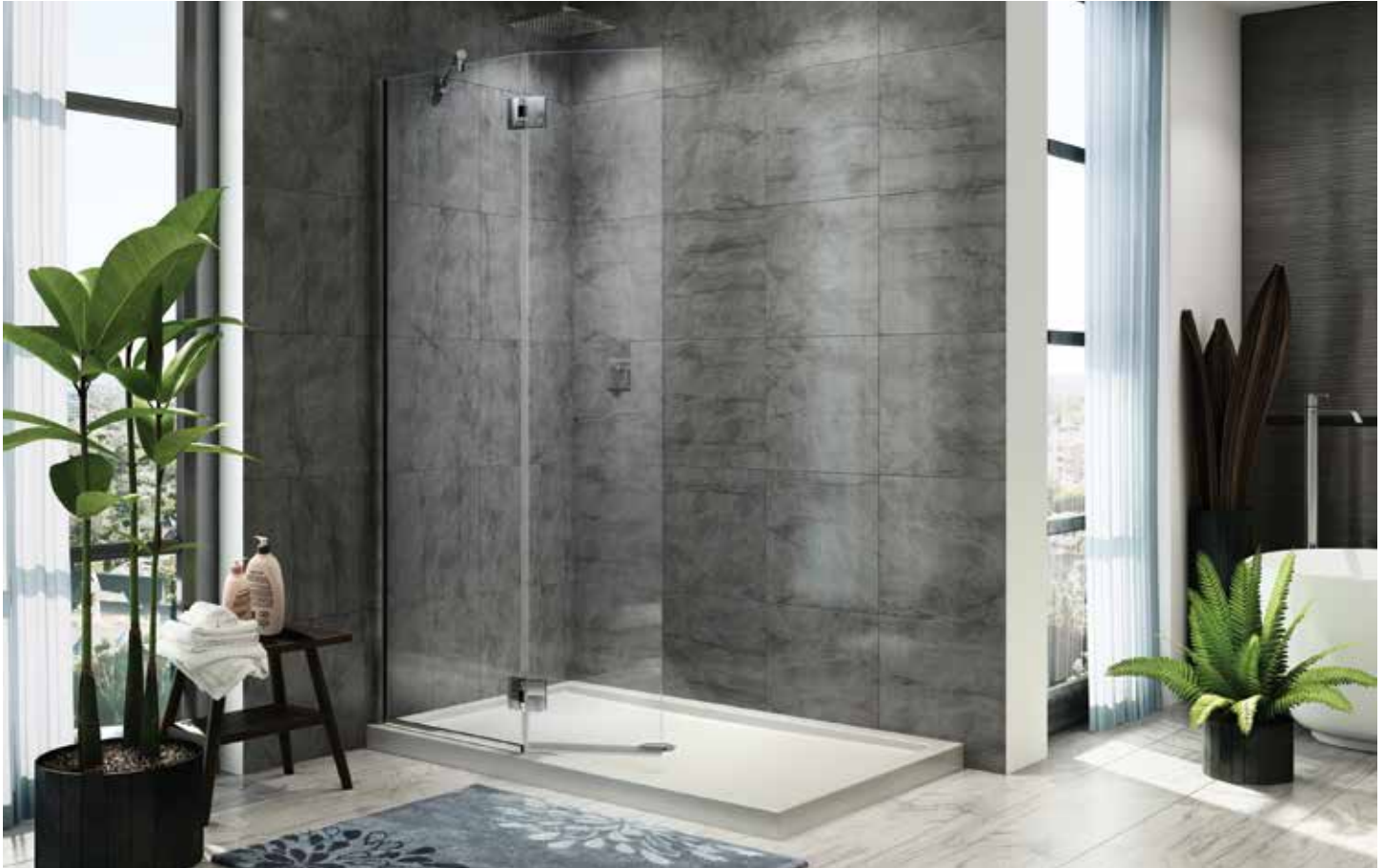
Model shown / Modèle présenté : VWXSS24-11-40L-M